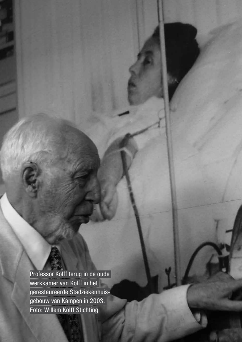
Professor Kolff terug in de oude werkkamer van Kolff in het gerestaureerde Stadsziekenhuis- gebouw van Kampen in 2003.